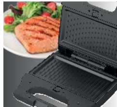
Панели для жарки «Гриль»