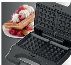
Панели для выпекания вафель

Использовать минипекарь очень легко. Устройство снабжено световой индикацией подключения к сети и готовности к работе. Защита от перегрева предотвращает повреждение устройства. Прибор можно хранить в вертикальном положении, поэтому он не займет много места на Вашей кухне.