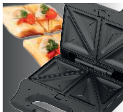
Панели для приготовления сэндвичей