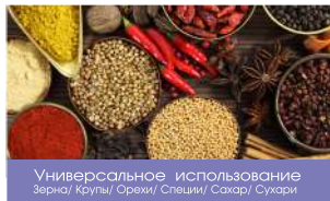
Универсальное использование Зерна / Крупы / Орехи / Специи / Сахар / Сухари