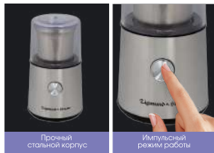
Прочный стальной корпус